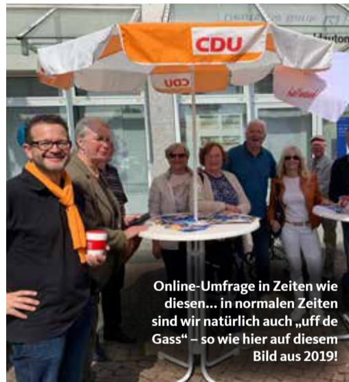
Online-Umfrage in Zeiten wie diesen... in normalen Zeiten sind wir natürlich auch „uff de Gass“ – so wie hier auf diesem Bild aus 2019!

Link zu finden: www.cdu-hofheim.de/umfrage