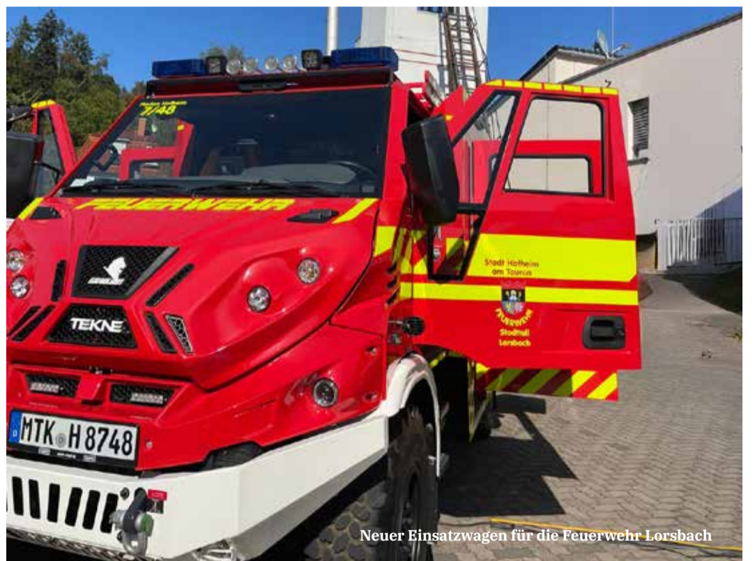
Neuer Einsatzwagen für die Feuerwehr Lorsbach

lienhäuser, Einfamilienhäuser sowie seniorenrechtliche Wohnungen. Auch ein Arzt- und Gesundheitshaus ist für diese Fläche vorgesehen, was die Lebensqualität weiter verbessern dürfte. Zudem hat die Planung der Wallauer Spange mit S-Bahn-Haltepunkt weiter Fahrt aufgenommen. Der Baubeginn ist für 2026 geplant, die Inbetriebnahme soll 2028/29 erfolgen. Somit wird Wallau erheblich besser an Frankfurt, den Flughafen sowie Wiesbaden angebunden. Durch diese nachhaltige Nahverkehrsplanung wird der Bedeutung Wallaus als starkem Wirtschaftsstandort und lebenswertem Wohnort im Herzen des Rhein-Main-Gebietes Rechnung getragen.