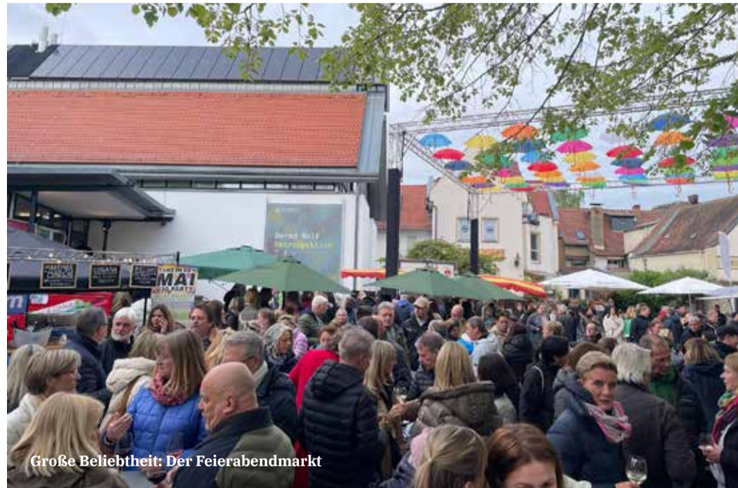
Große Beliebtheit: Der Feierabendmarkt