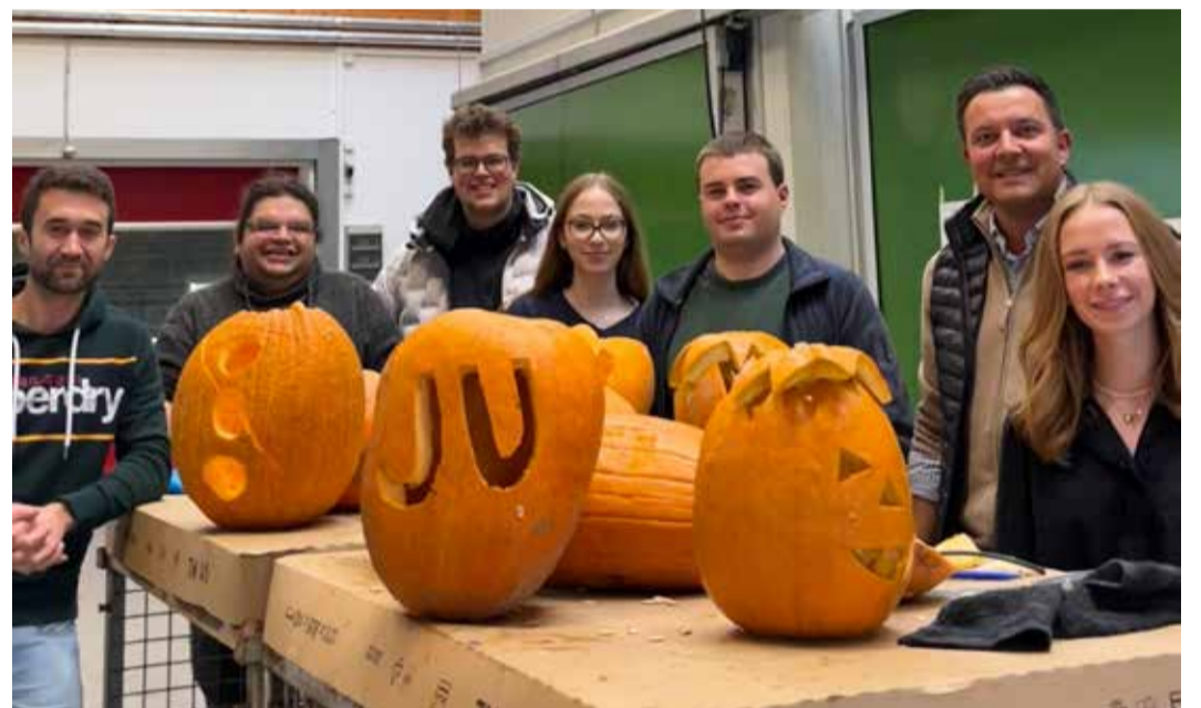
Passend zu Halloween, hat die Junge Union Main-Taunus, gemeinsam mit Bürgermeister Christian Vogt, am letzten Oktober Wochenende eine Kürbisschnitt-Aktion auf dem Birkenhof in Hofheim veranstaltet.