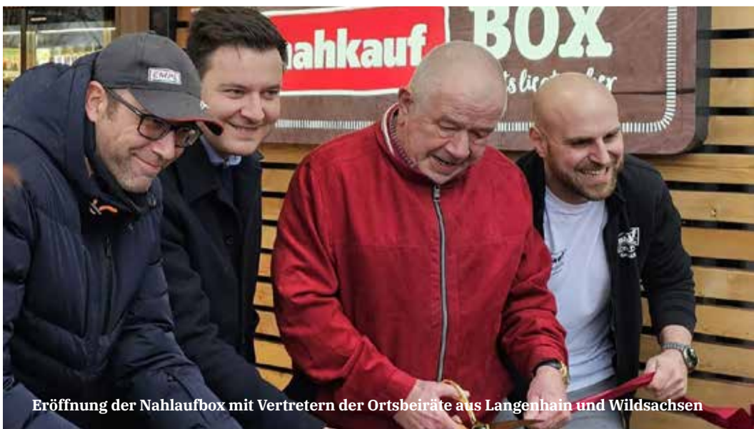
Eröffnung der Nahkaufbox mit Vertretern der Ortsbeiräte aus Langenhain und Wildsachsen

Des Weiteren ist eine neue Feuerwache in Planung, womit auch Wildsachsens Brandschützer modernste Räumlichkeiten bekommen werden. Durch das neue Wohngebiet „Jungehag 2“ entsteht Wohnraum insbesondere für junge Familien. Mit diesen Perspektiven wird eine hohe Lebensqualität in Wildsachsen erhalten und ausgebaut werden können.