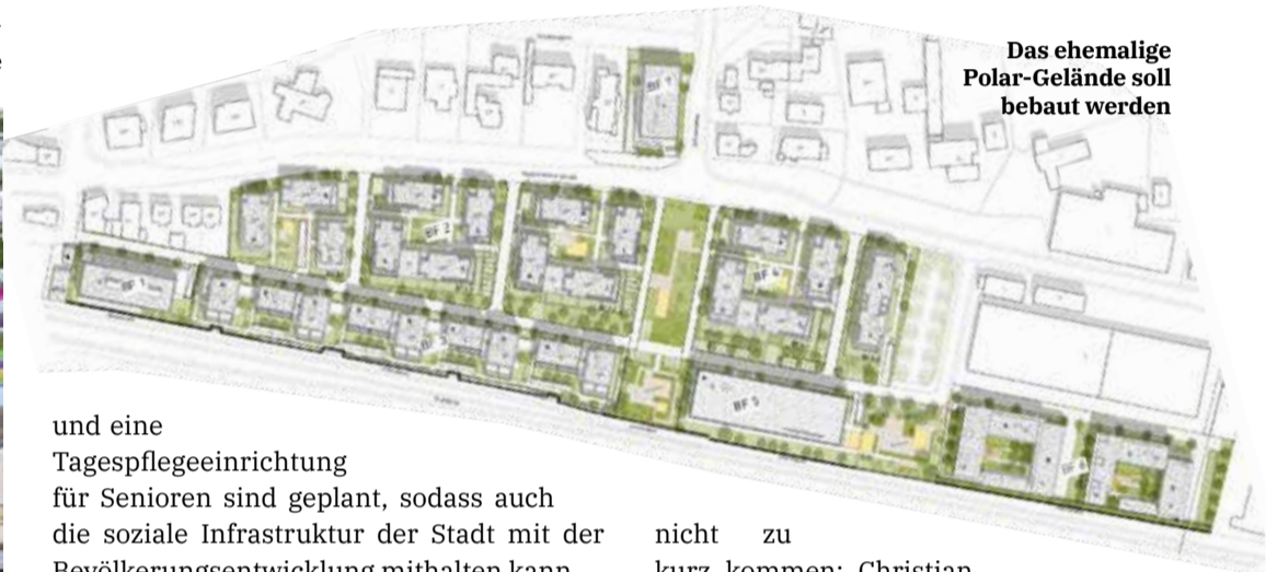
Das ehemalige Polar-Gelände soll bebaut werden

und eine Tagespflegeeinrichtung für Senioren sind geplant, sodass auch die soziale Infrastruktur der Stadt mit der Bevölkerungsentwicklung mithalten kann. Allerdings hat sich in den vergangenen Jahren nicht nur in Innenstadtnähe, sondern auch im Hofheimer Norden manches getan. So konnte die Eröffnung des neuen Stadtteiltreffs Nord gefeiert werden. Zwischen Finanzamt und Feuerwache ist zudem ein neu gestaltetes Ballsportareal entstanden. Auch die Vernetzung mit anderen Stadtteilen soll